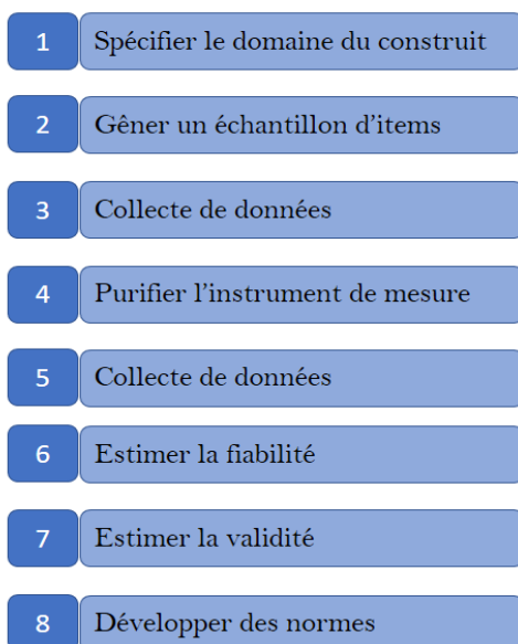
Fig 2 : Les étapes de la démarche CHURCHILL